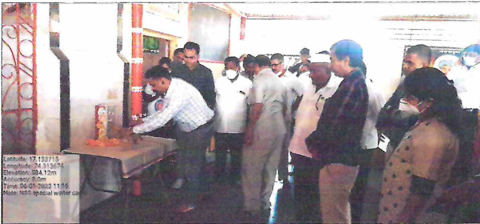
Special winter camp