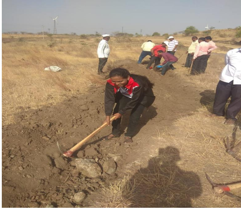
Shramdan by NSS Volunteer at Paani foundation