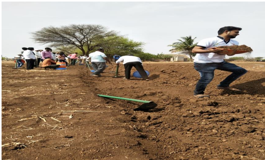
Shramdan by NSS Volunteer at Paani foundation

Water conservation rally was conducted in Dudhgaon in March 2020