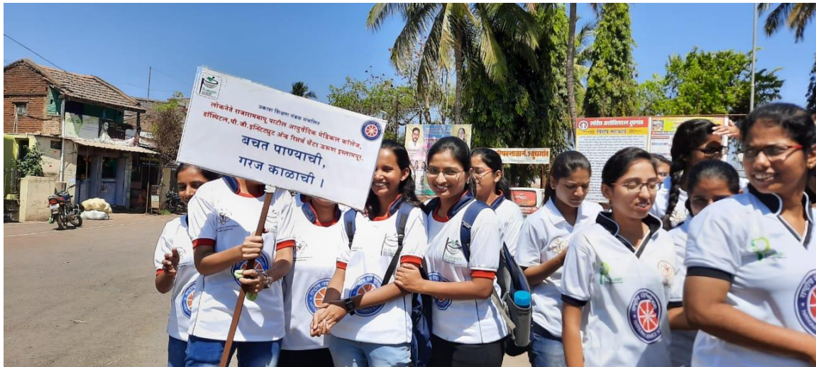
Water conservation rally in Dudgaon village