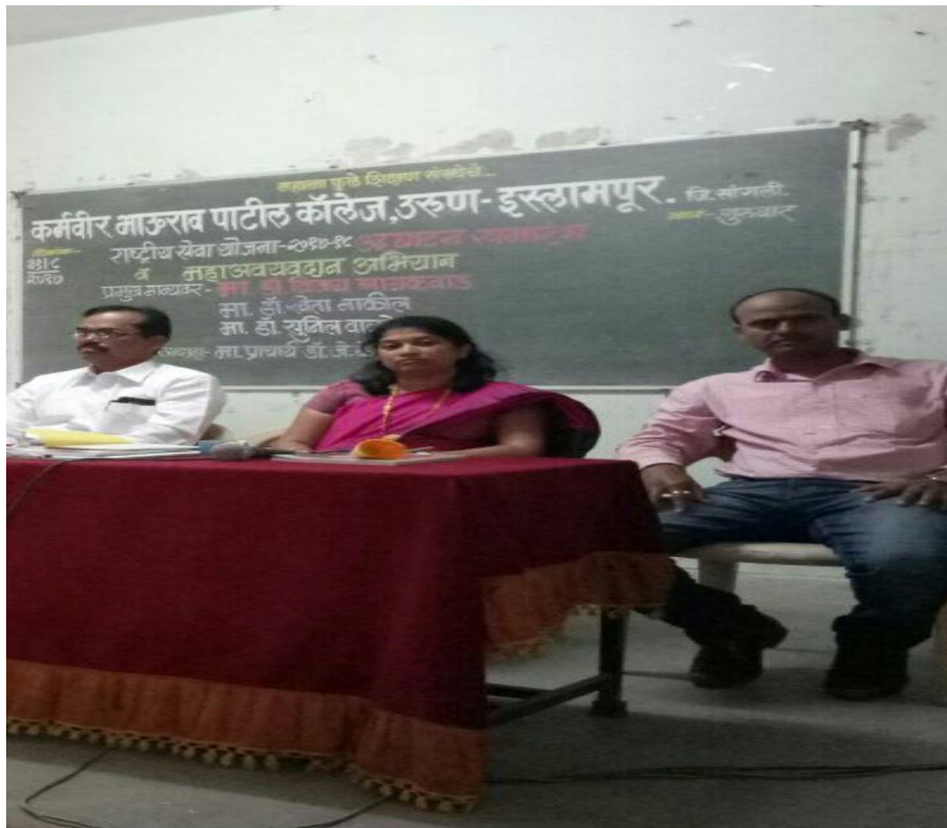
Organ donation awareness Rally In 2020