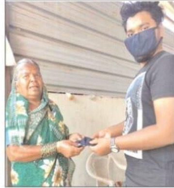
प्रकाश शिक्षणच्या आयुर्वेदिक वैद्यकीय महाविद्यालयाच्या स्वयंसेवकांनी मास्क वाटप केले.