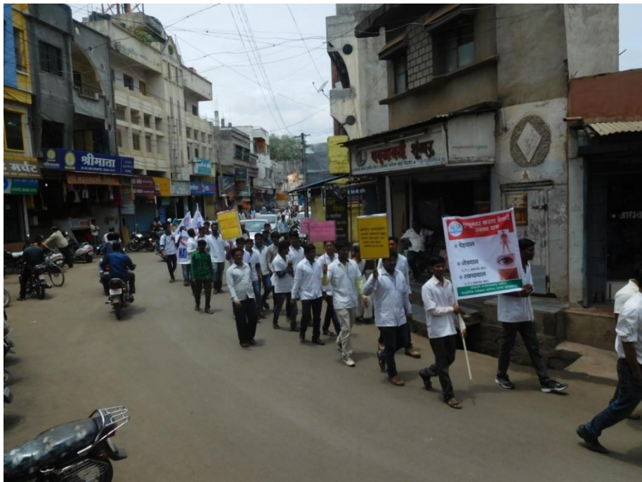
Organ donation awareness rally in Islampur town