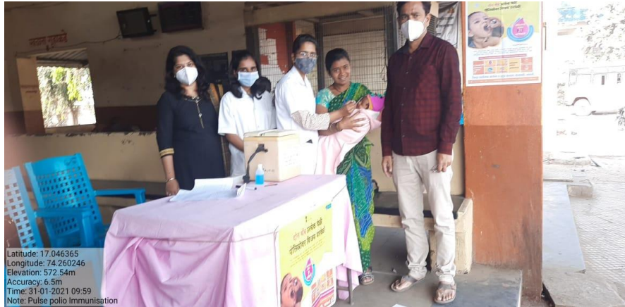
Visit to different Polio booths in Islampur town